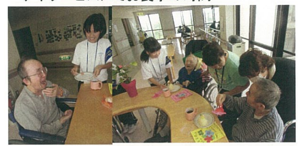
この日は特養でお誕生日会が行われ、中学生さん とのふれあいに笑顔が溢れていました。 ケーキを食べさせてもらって嬉しそうでした。