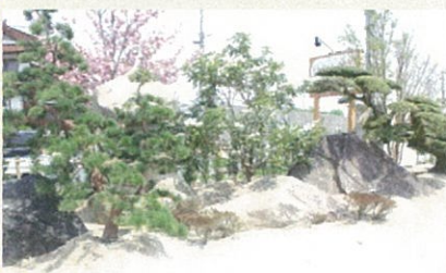
緑いっぱいのお庭