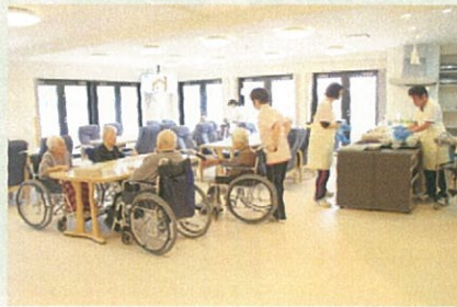
明るく広々とした食堂でお食事