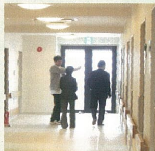
見学の方も来園されました