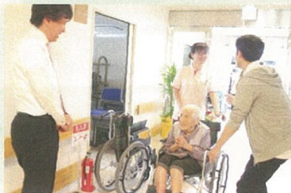
桑野施設長のお出迎え