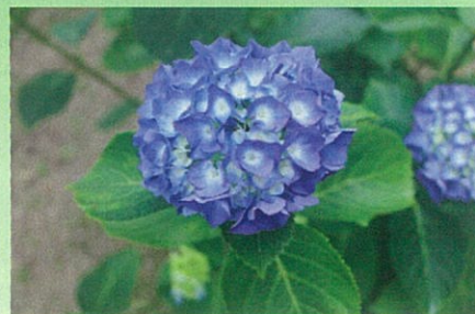
成寿園の紫陽花(アジサイ)

梅の実が熟す頃に、雨が続くことに由来する「入梅」は、「梅雨入り」とも呼ばれ、暦の上では夏至の10日前後にあたります。今のように気象予報が発達していなかった昔は、入梅の日から30日間を「梅雨」としていました。カビが生えやすい時期に由来して「微雨」と呼ばれ、これが転じて、「梅雨」となったという説もあります。