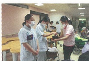
法話会で焼香をする生徒さん

5月19日～29日の期間、特別養護老人ホーム成寿園に黒瀬高校の生徒さん2名が介護実習に来園されました。最終日の29日は生徒さん達によるレクリエーションが行われました。棒体操やボール投げゲーム・「茶摘みの歌」を歌ったり入所者様も童心に戻って楽しめました。卒業されましたら是非成寿会の一員となって働いて頂ける日をお待ちしております。