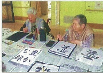
みなさん真剣に集中

5月14日、老人保健施設成寿園にて、書道を得意とする介護職員が担当して、書道教室を開催。ご利用者の中には、達人の様な腕前の方もいらっしゃり、まわりを驚かせました。