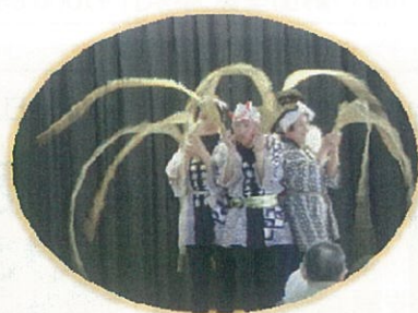
見事なタコの出来上がり