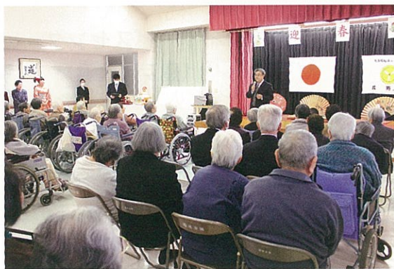
特別養護老人ホーム成寿園 2階にて