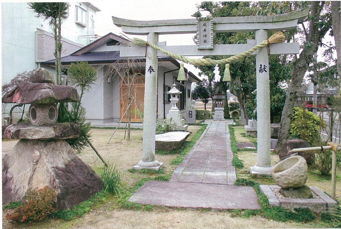
「元郷田村庄屋荒谷家屋敷跡地に合祀建立」された成寿神社