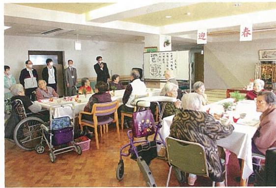
老人保健施設成寿園1階 デイケアルームにて