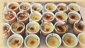
できたてのさつまいもプリン

12月12日、老人保健施設成寿園にて、先月大浜で収穫したさつまいもを使ってさつまいもプリンを作りました。ご入所者様と一緒にさつまいもを練り、バーナーで炙って焼きプリンに仕上げ、とっても香ばしい匂いでいっぱい！皆様、食べるのが待ちきれない様子でした。スイートポテトのような食感でとてもおいしく出来上がり、「おいしいね〜」「もう一個食べたいわ〜」と大変喜ばれていました。